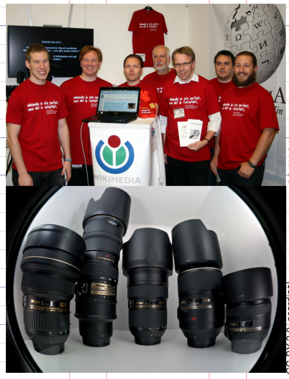
CC-BY-SA 3.0, LAZ CC-BY 2.0, gaurandhi