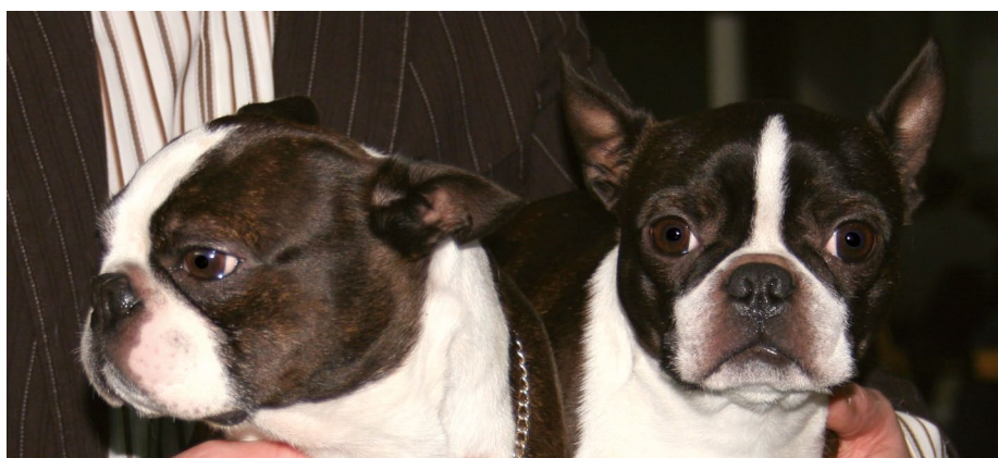
Boston teriery na światowej wystawie psów w Poznaniu. Zdjęcie po redukcji efektu czerwonych oczu.