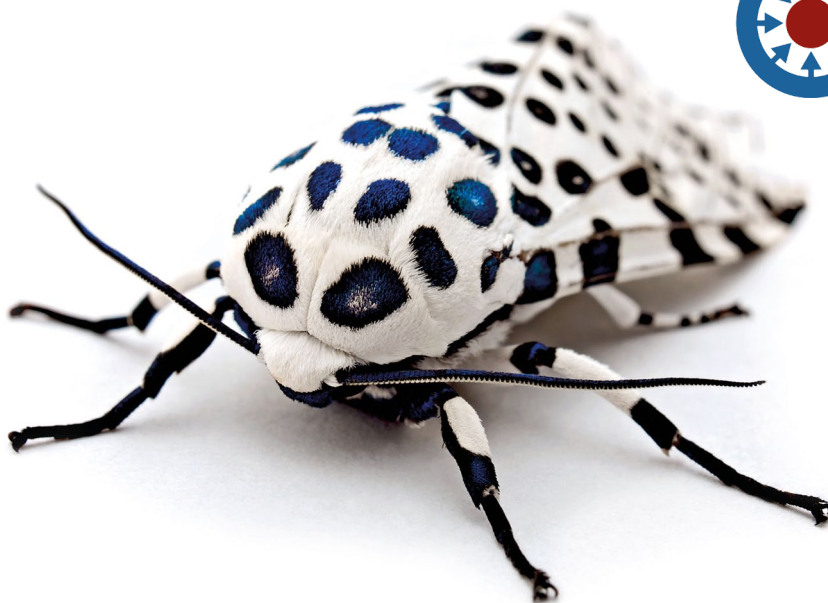
Ćma Hypercompe scribonia. Jeden z finalistów konkursu w 2009 r. Źródło:Wikimedia Commons. Autor: Kevincollins123. Licencja: CC-BY-SA 3.0 .