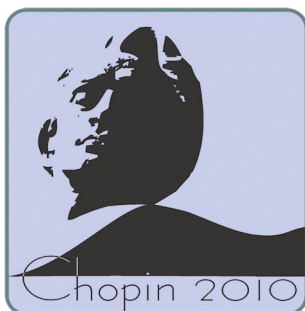
Logo Wikiprojektu Chopin. Źródło: Wikimedia Commons. Autor: Steifer. Licencja: CC-BY-SA 3.0.