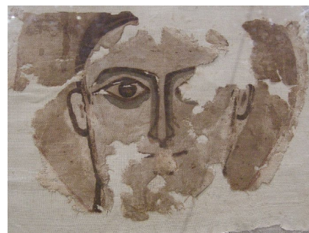
Malowidło na tkaninie, 6-7 wiek. Coptic Museum, Kair. Źródło: Wikimedia Commons. Autor zdjęcia: EgyArt. Licencja: CC-BY-SA 3.0

Projekt Ethno-Wiki, działający od pewnego czasu w Wikimedia Commons, ogłosił w marcu 2010, że pozytywnie zakończył