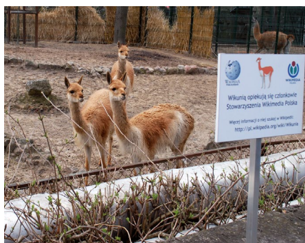
Wikunie w łódzkim ZOO.

Pod opieką Stowarzyszenia znajduje się rodzina wikuni z łódzkiego ogrodu zoologicznego. Przy wybiegu została już zainstalowana tablica informacyjna o opiekunach. Rodzina składa się z dorosłego samca, samicy i dwóch młodych, urodzonych w ZOO. Cytując za Wikipedią: „Naturalny zasięg występowania tego gatunku obejmuje Peru, Boliwię, Chile i Argentynę. W Ekwadorze został introdukowany. [...] Żyje na stokach Andów, w suchym i zimnym klimacie, na dużych wysoko-