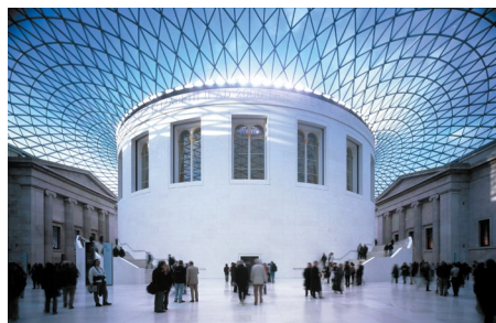
Centrum Muzeum Brytyjskiego