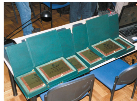
Dyplomy wręczone laureatom.