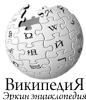
Википедия Эркин энциклопедия

Uruchomiono nową edycję językową Wikipedii ( http://krc.wikipedia.org ) – która ma być stworzona w języku karaczajsko-bałkańskim .