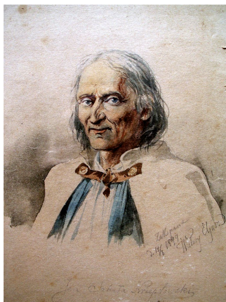
Jan Sabala Krzeptowski – akwarela. Źródło: Wikimedia Commons. Autor: Walery Eljasz-Radzikowski. W domenie publicznej.

W kwietniu minął rok od powstania Dnia Sztuki w Wikipedii pod patronatem Czy wiesz. Pomysłodawcami byli Staszek99 i Adamt . Celem inicjatywy było propagowanie, poprzez tworzenie nowych artykułów, szeroko rozumianej sztuki. Początkowo aktywność uczestników głównie koncentrowała się na opisach obrazów wielkich mistrzów malarstwa. Dwanaście miesięcy podzielono na dwanaście te-