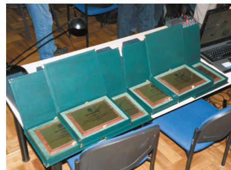
Dyplomy wręczone laureatom.