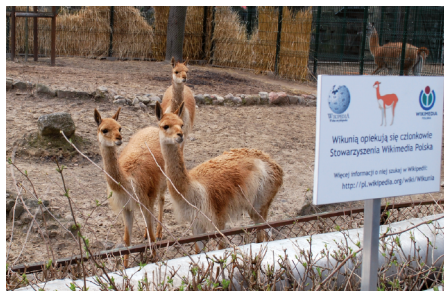
Wikunie w łódzkim ZOO.

Pod opieką Stowarzyszenia znajduje się rodzina wikuni z łódzkiego ogrodu zoologicznego. Przy wybiegu została już instalowana tablica informacyjna o opiekunach. Rodzina składa się z dorosłego samca, samicy i dwóch młodych, urodzonych w ZOO. Cytując za Wikipedią: „Naturalny zasięg występowania tego gatunku obejmuje Peru, Boliwię, Chile i Argentynę. W Ekwadorze został introdukowany. [...]”