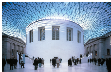
Centrum Muzeum Brytyjskiego