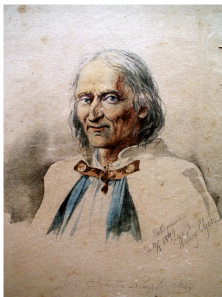
Jan Sabała Krzeptowski – akwarela. Źródło: Wikimedia Commons. Autor: Walery Eljasz-Radzikowski. W domenie publicznej.