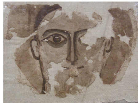
Malowidło na tkaninie, 6-7 wiek. Coptic Museum, Kair.

Projekt Ethno-Wiki, działający od pewnego czasu w Wikimedia Commons, ogłosił w marcu 2010, że pozytywnie zakończył