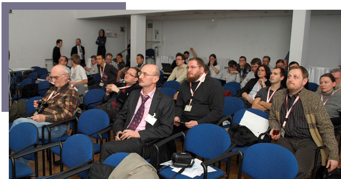
Walne Zebranie Członków WMPL w Warszawie, 27 marca 2010.

W związku z zakończeniem kadencji starych władz Stowarzyszenia, Walne wybrało władze na kolejną kadencję: Prezesa, 4 członków Zarządu, 3 członków Komisji Rewizyjnej i 3 członków Sądu Koleżeńskiego.