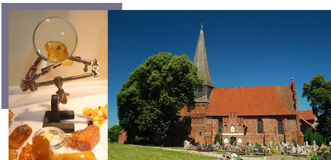
Jantar, Muzeum Bursztynu.

Poruszając się po różnych trasach każda z grup zbierała materiały o innym obszarze i fotografowała obiekty o różnym charakterze. Fotografowano między innymi przyrodę w parkach narodowych i rezerwach w Borach Tucholskich oraz na Kaszubach, zabytki i inne obiekty architektury w miejscowościach w obrębie Kociewia, Mazur Zachodnich i Warmii, Żuław i w okolicach Gdańska, wybrzeże Bałtyku od Gdańska do Koszalina, przyrodę Wdzydzkiego Parku Krajobrazowego i okolic oraz zabytki sakralne Gdańska.