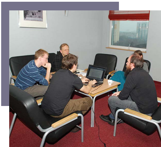
Obrady podczas Sabatu 2010. Autor: Polimerek. Źródło: Wikimedia Commons. Licencja: CC BY-SA 3.0*

Dyskusje nad Wikinews przyczyniły się między innymi do ponownego uruchomienia kanału RSS projektu i powstania strony z linkami do serwisów, które potem są zachęcane do przejścia na licencję Creative Commons Uznanie Autorstwa (CC BY) i nawiązania współpracy z projektem. Wydzielone zostały obszary, w których podejmowane są działania, w tym: pobieranie informacji z innych serwisów na licencji CC BY i ich obróbka, przygotowanie cyklu wywiadów z encyklopedycznymi wikipedystami, przygotowywanie materiałów audio z zapisem wywiadów publikowanych w projekcie, czy przebudowa portali tematycznych.