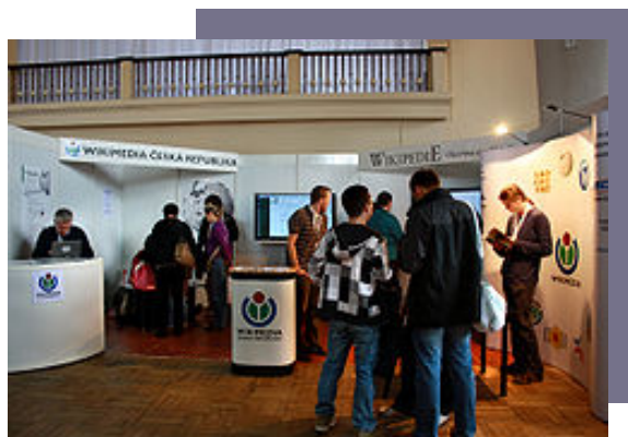
Stoisko WMCZ. Autor: Packa. Źródło: Wikimedia Commons. Licencja: CC BY-SA 3.0*

Tłumaczenie wydane zostało na licencji Creative Commons Uznanie autorstwa Na tych samych warunkach.