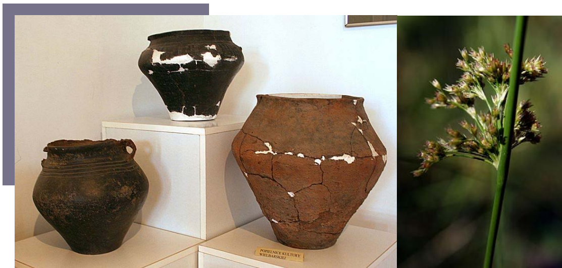
Popielnice w muzeum w Odrach. Autor: Przykuta. Źródło: Wikimedia Commons. Licencja: GFDL, CC BY-SA 3.0*