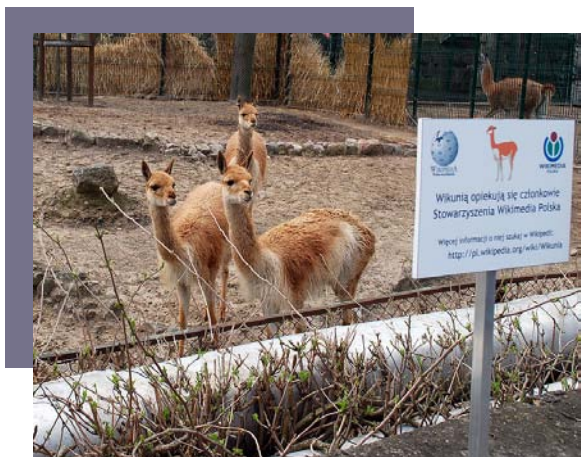
Rodzina Wikuni w Łódzkim ZOO.