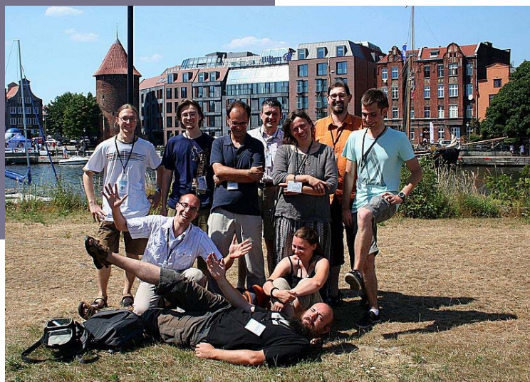
Uczestnicy Wikiekspedycji podczas Wikimanii 2010. Autor: Ambiwalentna. Źródło: Wikimedia Commons. Licencja: CC BY-SA 3.0*

Zarząd Stowarzyszenia uchwalił program stypendialny (Uchwała Zarządu 14/2010), niezależny od tego prowadzonego przez Fundację Wikimedia. Celem programu było dofinansowanie uczestnictwa w Wikimanii 2010 wikimedianom z Polski i krajów ościennych. Program był prowadzony we współpracy z Wikimedia Rosja i Wikimedia Ukraina.