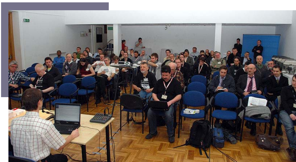
Uczestnicy Konferencji Wikimedia Polska 2010. Autor: Polimerex. Źródło: Wikimedia Commons. Licencja: CC BY-SA 3.0*

W konferencji uczestniczyło łącznie ok. 100 osób, w tym 2 gości z Rosji, 2 z Ukrainy oraz dwoje przedstawicieli Wikimedia Foundation. Stowarzyszenie pozyskało sponsora, który wsparł finansowo i sprzętem organizację wydarzenia. Patronat medialny nad konferencją objęło Wikinews.