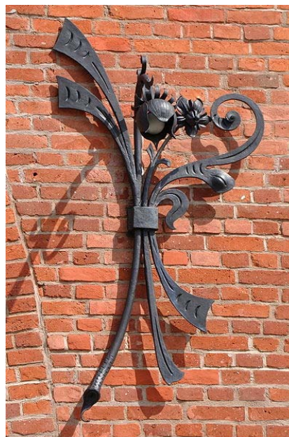
Pierwsza nagroda w konkursie FotoWiki 2010: Lampa na Beczkach Grohmana.

W trakcie warsztatów zorganizowano konkurs na najlepsze prace. W pierwszym etapie komisja konkursowa wybrała spośród wszystkich zdjęć około sto najlepszych. Trzeciego dnia warsztatów komisja omówiła wady i zalety wybranych zdjęć, a następnie wyróżniono cztery z nich, przyznając pierwszą, drugą i trzecią nagrodę oraz nagrodę publiczności.