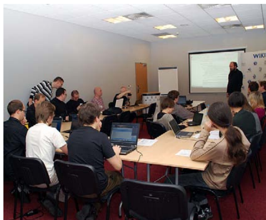
Obrady podczas Sabatu 2010.

Poruszono wiele kwestii związanych z pracą wewnątrz projektów oraz możliwych pól współpracy międzyprojektowej.