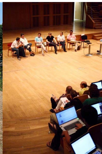
Panel dyskusyjny podczas Wikimanii 2010.