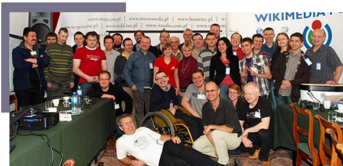
Uczestnicy GDJ 2010.

W wyniku prac zapoczątkowanych w trakcie spotkania GDJ 2010 ustanowione zostało nowe wyróżnienie dla treści w Wikipedii – Grupa Artykułów. Są to zestawy najlepszych artykułów, które opisują w pełni dany temat i spełniają dodatkowe, precyzyjnie określone warunki jakości.