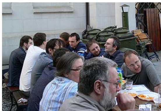
Uczestnicy Złotu pod Syrenką.

Głównym przedmiotem dyskusji był Wikiprojekt Warszawa, skupiający edytorów zainteresowanych tematyką powiązaną z tym miastem. Przedstawiono propozycję koordynacji prac w ramach wikiprojektu oraz omówiono potrzebę uporządkowania zasobów graficznych i multimedialnych zgromadzonych w kategorii „Warszawa” w Wikimedia Commons. Przedyskutowano również propozycję organizacji wycieczek po Warszawie i jednodniowych wypraw w jej okolicy, w celu wykonywania dokumentacji fotograficznej.