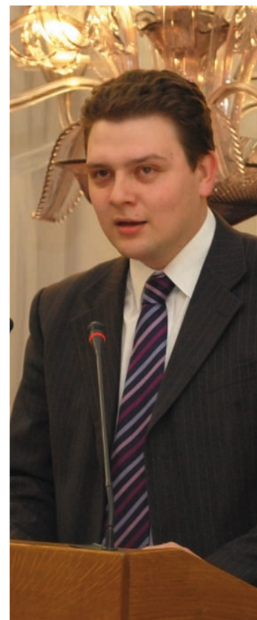
Poseł Krzysztof Tyszkiewicz Foto: Polimerek; licencja: CC-BY-SA 2.5, 2.0, 1.0