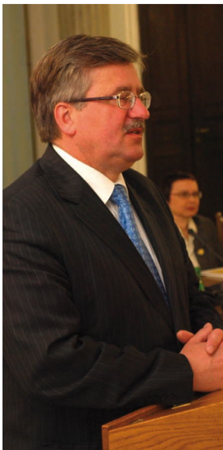
Marszałek Sejmu RP Bronisław Komorowski.