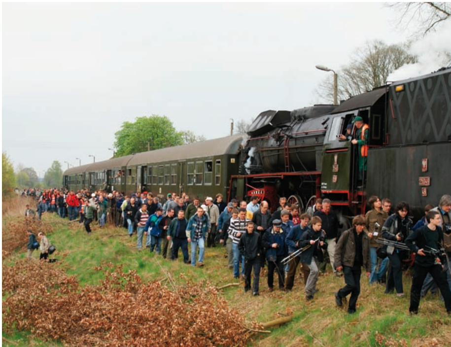
Działamy też w terenie – zdjęcie z fotorelacji imprezy „Parowozem przez Wielkopolskę”.