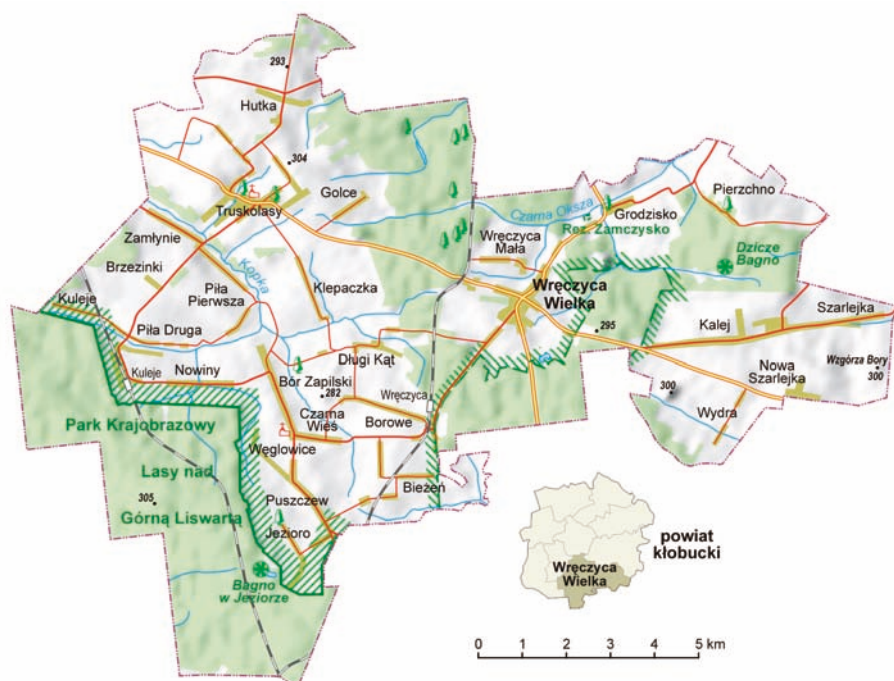
Mapa gminy Wręczyca Wielka wykonana przez Aotearoa (licencja: GFDL). Znajdujące się na niej miejscowości sfotografowane zostały przez Ludmiłę Pilecką