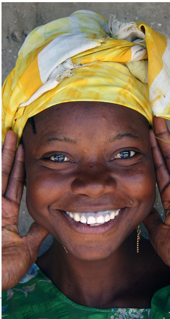
Dziewczyna z Gambii, fot: Ferdinand Reus licencja: CC-BY-SA 2.0'

krok nie będzie nigdy rościł sobie żadnych praw, zatem można jego utworów używać tak, jakby były w domenie publicznej. Utwory w ten sposób uwolnione mają jednak tę samą słabość, co twórczość na licencji CC-BY - należy pamiętać, że w domenie publicznej jest tylko dzieło oryginalne, utwór zależny jego autor może całkowicie zastrzec, czego nie mógłby uczynić, gdyby autor dzieła pierwotnego udostępnił go na licencji CC-BY-SA, GNU FDL albo FAL.