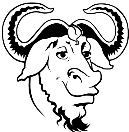
Głowa GNU - symbol Free Software Foundation, autor Aurelio A. Heckert, 12 grudnia 2005, Free Art License 3

Licencja GNU FDL nakłada następujące wymagania (zarówno przy użyciu kopii dosłownych utworów jak i tworzeniu utworów zależnych):