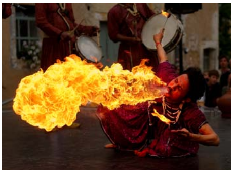
Kandydat do tytułu "Zdjęcie roku 2008"

Jeśli ktoś szuka zdjęć, grafik, nagrań audio lub wideo, które można dowolnie wykorzystać, warto zajrzeć na Wikimedia Commons. Projekt powstał 7 września 2004 r. jako repozytorium ilustracji, zdjęć i plików multimedialnych dla wszystkich wersji językowych Wikipedii i bardzo szybko stał się cennym źródłem zasobów także dla pozostałych projektów Wikimedia. Dzięki temu, że wszystkie zawarte w nim materiały są dostępne na wolnych licencjach, jest on przydatny także dla osób z zewnątrz. W kwietniu 2009 r. serwis zawierał niemal 5 milionów plików, znajdujących się w domenie publicznej lub umieszczonych przez autorów na jednej z dozwolonych wolnych licencji, np. Creative Commons Attribution Share-alike czy Licencji Wolnej Dokumentacji GNU.