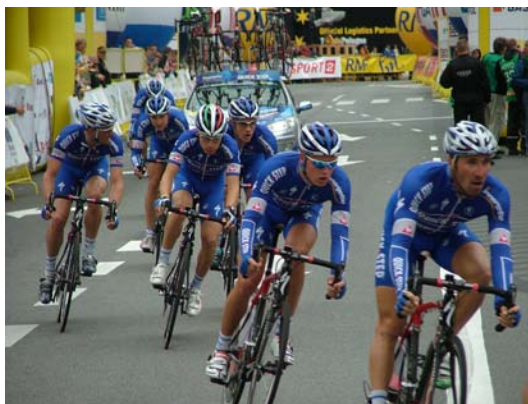
Fotoreportaż z Tour de Pologne 2007

Wikinews w wersji polskojęzycznej uruchomione zostało 19 lutego 2005 r. Dzięki nawiązaniu współpracy z innymi serwisami informacyjnymi wiele wiadomości zamieszczanych w Wikinews opracowywanych jest na bazie źródeł zewnętrznych, jednak nie brakuje także materiałów autorskich. Reporterzy Wikinews przeprowadzają interesujące wywiady m.in. z osobistościami