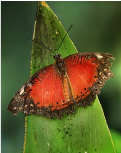
Cethosia cyane

Chociaż głównym językiem stosowanym w projekcie jest język angielski, to w nazewnictwie haseł dominuje łacina, jako że w tym języku nadawane są nazwy wszelkim organizmom żywym. Projekt nie posiada odrębnych wersji językowych, za to w każdym haśle znajdują się informacje o nazwach danego gatunku stosowanych w poszczególnych językach narodowych.