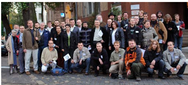
Spotkanie społeczności polskich projektów, Poznań 2008

Zastosowanie modelu wolnej twórczości umożliwia edytorom naszych projektów wspólną pracę. Każdy może raz umieszczone treści dowolnie poszerzać, przerabiać lub przenosić w inne miejsce. Raz wstawiony tekst może zatem być swobodnie rozwijany i poszerzany spontanicznie przez kolejnych twórców. Czasami, gdy sprawy wezmą zły obrót można również rozwijający się spontanicznie tekst usunąć, cofnąć do wcześniejszej wersji lub podzielić na mniejsze fragmenty. To właśnie model wolnej twórczości zapewnia tak dynamiczny charakter rozwoju projektów Wikimedia.