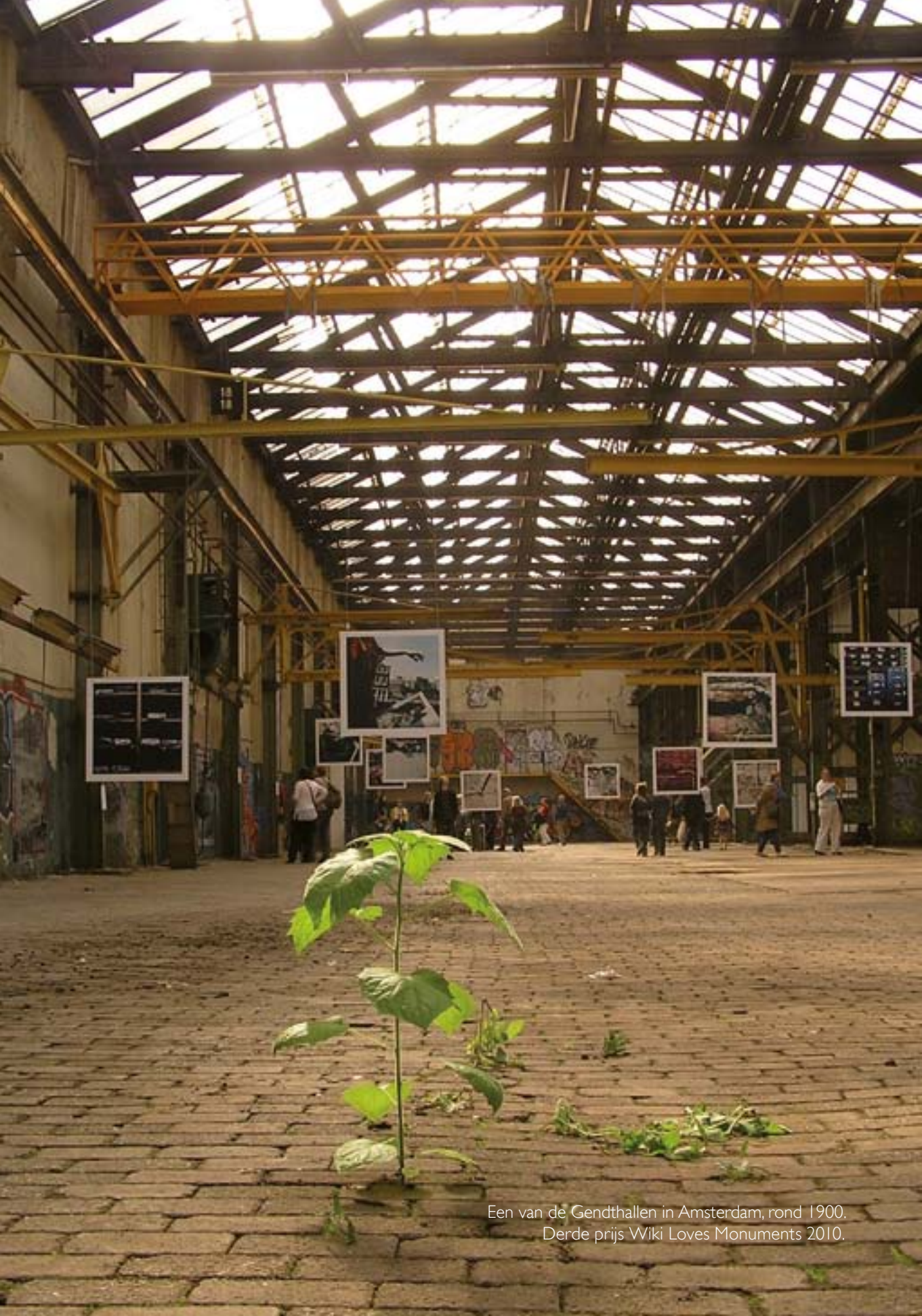
Een van de Gendhallen in Amsterdam, rond 1900. Derde prijs Wiki Loves Monuments 2010.