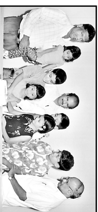
KARIMNAGAR FILM SOCIETY