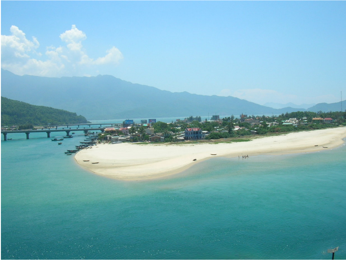
Abb. 33: Lãng Cô-Strand in Huế 522