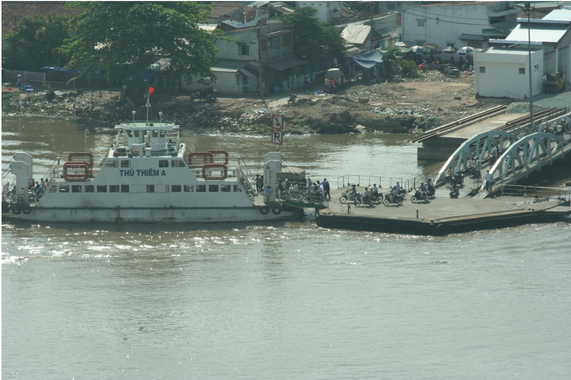
Abb. 25: Schiffsverkehr

Vietnam verfügt über etwa 5.000 Kilometer Wasserstraßen, die ganzjährig befahrbar sind. Besonders im Mekong-Delta ist der Wassertransport wichtig, und die Straßen werden durch zahlreiche Flussarme unterbrochen, die mittels Fähre überbrückt werden müssen.