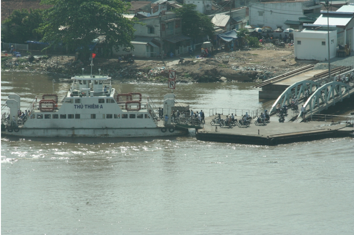
Abb. 25: Schiffsverkehr

Vietnam verfügt über etwa 5.000 Kilometer Wasserstraßen, die ganzjährig befahrbar sind. Besonders im Mekong-Delta ist der Wassertransport wichtig, und die Straßen werden durch zahlreiche Flussarme unterbrochen, die mittels Fähre überbrückt werden müssen.