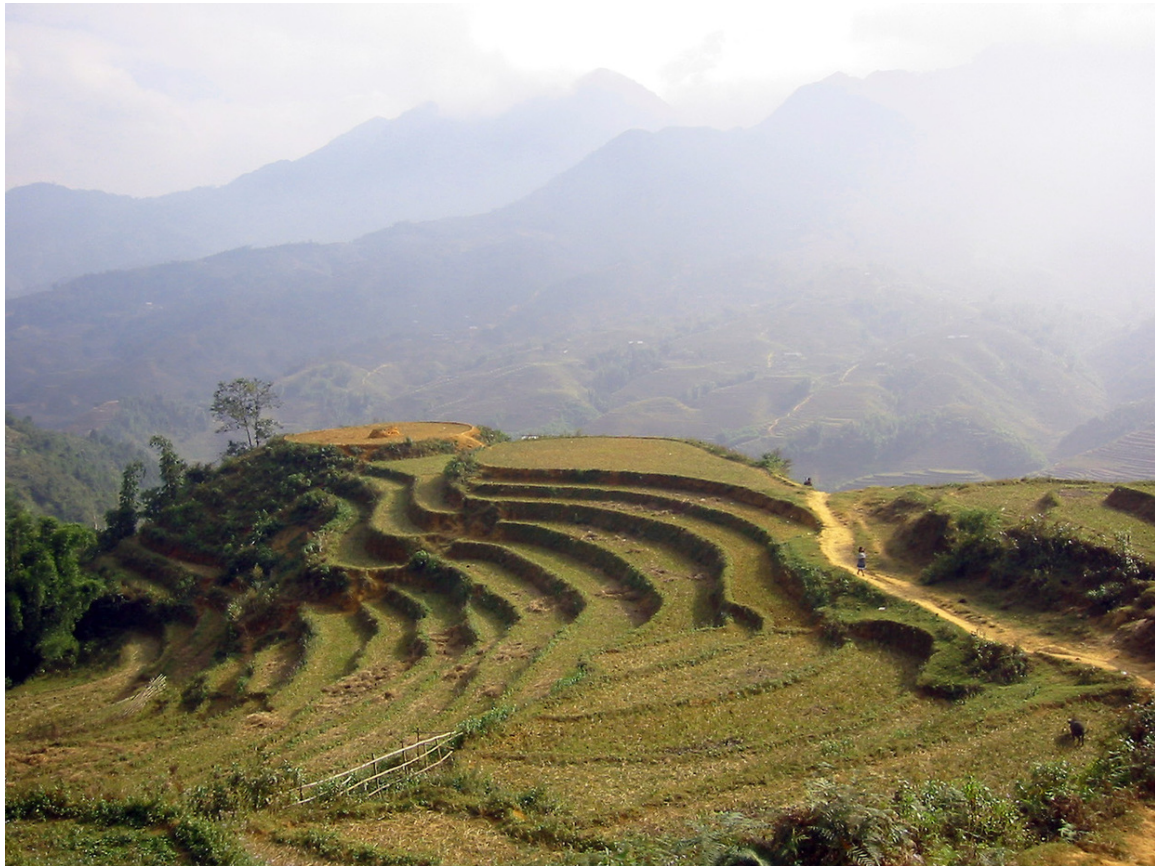
Abb. 31: Terrassenfeldbau in Nordvietnam

Vor der Einführung von Đổi Mới 500 waren private Unternehmen, abhängig vom Wirtschaftssektor, entweder verboten oder vernachlässigbar. Nur Familienbetriebe waren legal. Einige Zeit nach dem Beginn der Reformen, im Jahr 2002, betrug der Anteil des privaten Sektors am BIP 501 etwa 40 %, wobei der Anteil in der Landwirtschaft besonders hoch war und der Anteil an der Industrieproduktion etwa ein Drittel ausmachte.