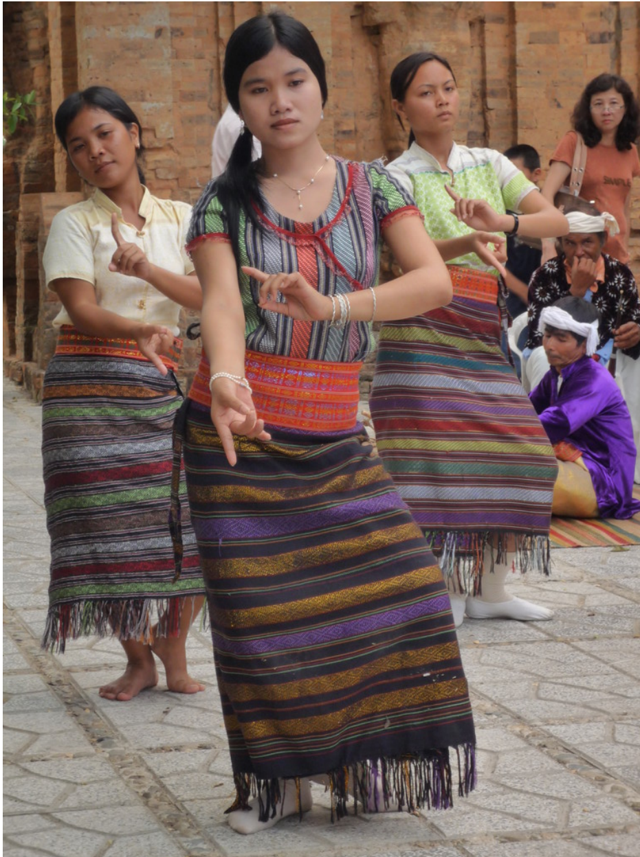
Abb. 10: Ein Tanz von CHAM 188 -Frauen vor ihrem Tempel