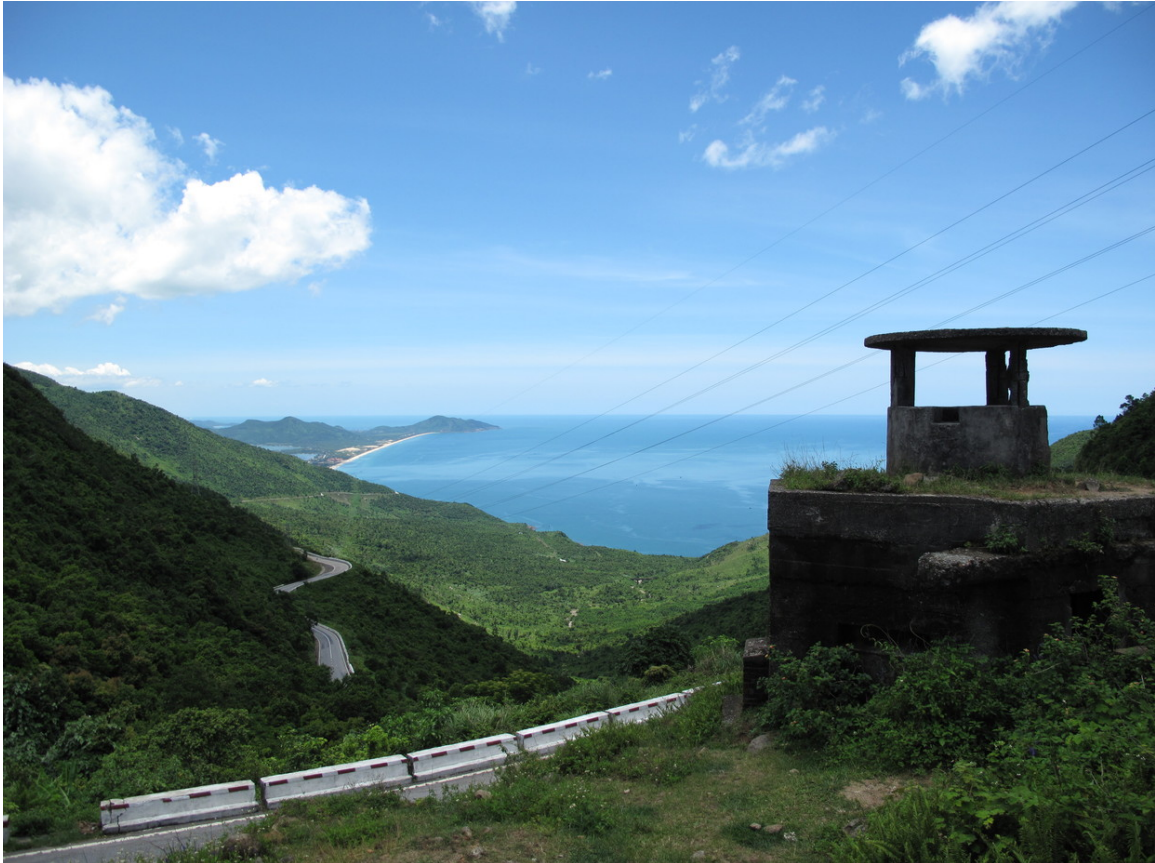
Abb. 7: HAI-VAN-PASS (WOLKENPASS) 93

Das Klima unterscheidet sich erheblich zwischen Nord- und Südvietnam. Der Norden weist ein gemäßigtes TROPISCHES WECHSELKLIMA 94 auf, es gibt eine kühle Jahreszeit von November bis