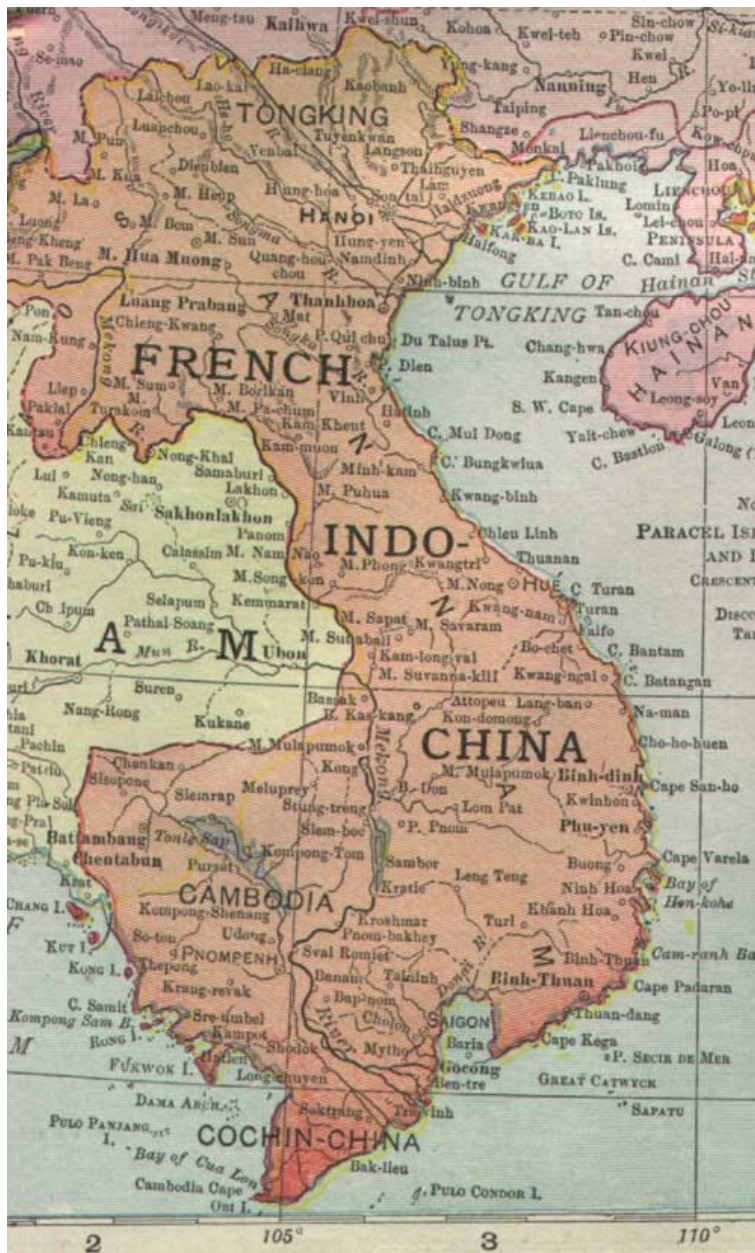
Abb. 16: Französisches Indochina 1913

→ Hauptartikel: VIETNAM UNTER FRANZÖSISCHER KOLONIALHERRSCHAFT 275 und VIETNAM WÄHREND DES ZWEITEN WELTKRIEGES 276