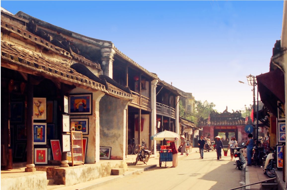
Abb. 34: Altstadt in HỒI AN 523

→ Hauptartikel: TOURISMUS IN VIETNAM 524