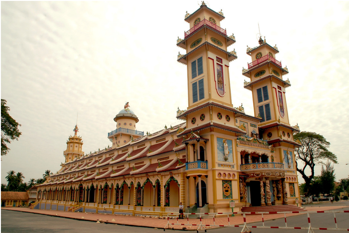
Abb. 13: CAO DAI 209 -Tempel in TÂY NINH 210

Genaue Angaben über die Religionszugehörigkeit in Vietnam sind schwer zu machen. Die große Mehrheit der Vietnamesen bekennt sich zu keinem Glauben. Laut einer 2004 veröffentlichten Studie sind 81,5 % der Vietnamesen ATHEISTEN 211 . 212 Schätzungen gehen von 7,6 Millionen Buddhisten und 6 Millionen Katholiken aus. Weitere Konfessionen sind CAO DAI 213 (2 Millionen Anhänger), HOA HAO 214 (1 Million), Protestantismus (500.000) und Islam (50.000). 215 Im Religionsverständnis der Vietnamesen gibt es keine strikte Trennung verschiedener Konfessionen. Die Religiosität ist zumeist eine historisch gewachsene Mischung mit vielen Aspekten unterschiedlicher religiöser Ursprünge. Es ist nicht unüblich, regelmäßig buddhistische PAGODE 216 n zu besuchen und ihre Ahnen zu verehren.