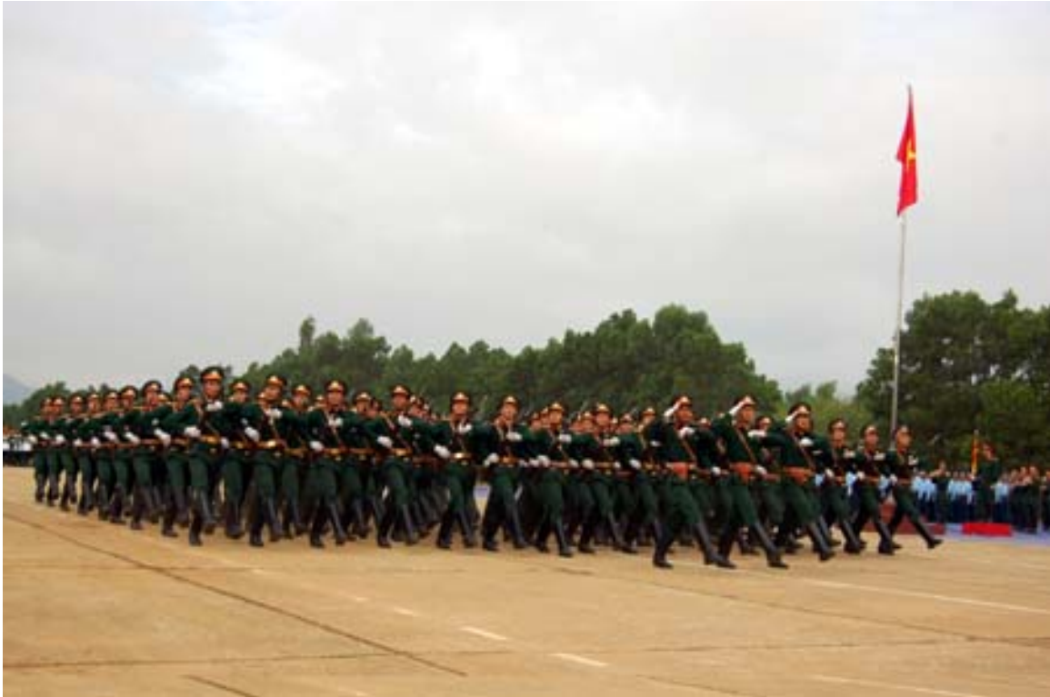
Abb. 21: Militärparade

Die VIETNAMESISCHE VOLKSARMEE 403 entstand in ihrer heutigen Form nach dem Ende des VIETNAMKRIEG 404 es im Jahre 1975 aus der NORDVIETNAMESISCHEN VOLKSARMEE 405 . Sie hat eine Stärke von etwa 412.000 Mann; es existiert eine allgemeine Wehrpflicht für alle Männer, die in der Regel zwei Jahre dauert. Die MARINE 406 hat 42.000 Mann; die modernste Teilstreitkraft Vietnams ist die Luftwaffe mit 30.000 Mann. Ihre Hauptstärke besteht aus 124 MiG-21 407 , 53 Su-22 408 und 12 Su-27 409 . 410