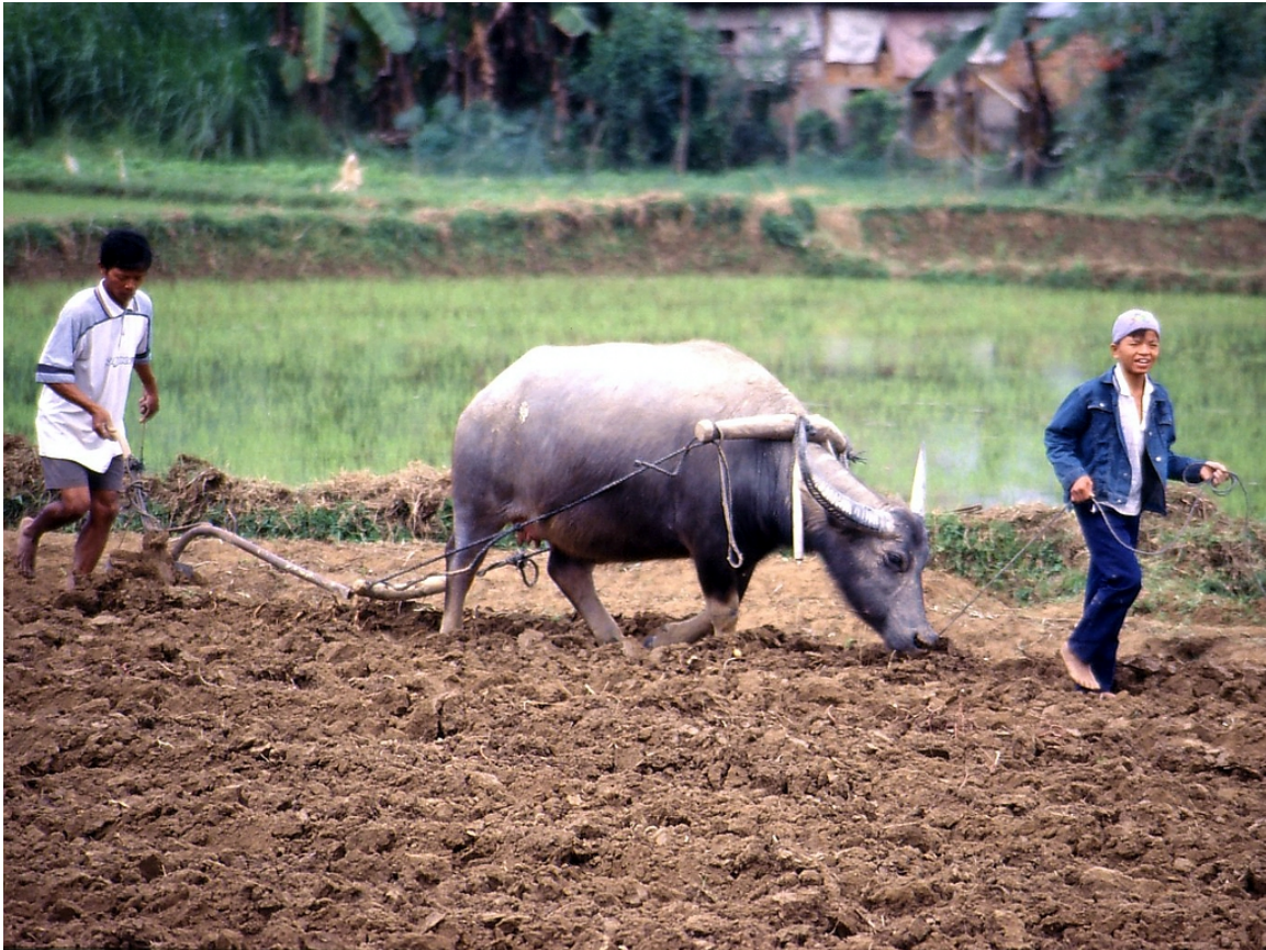
Abb. 30: Pflügen des Reisfeldes mit Wasserbüffel und Holzpflug

Vietnam war bis vor wenigen Jahren ein fast ausschließlich agrarisch geprägtes Land. Bis heute sind in der Landwirtschaft 65 % der Arbeitskräfte Vietnams tätig, jedoch trägt dieser Sektor nur mehr ein Fünftel des BIPs bei. Für 2007 verzeichnete man einen Zuwachs von 3,4 %, trotz zahlreicher Naturkatastrophen. 492