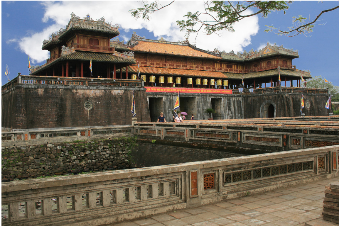
Abb. 15: Die Reichsstadt in Huế 247

Am Anfang des 10. Jahrhunderts brach in China die TANG-DYNASTIE 248 zusammen. Annam nutzte die Schwächephase, um sich der chinesischen Macht zu entziehen. Der erste vietnamesische Staat entstand 938 unter dem Strategen NGO QUYEN 249 . Bis 968 wurde der Staat unter DINH BO LINH 250 konsolidiert; bis 1009 wechselten sich jedoch mehrere kurzlebige Dynastien an der Macht ab.