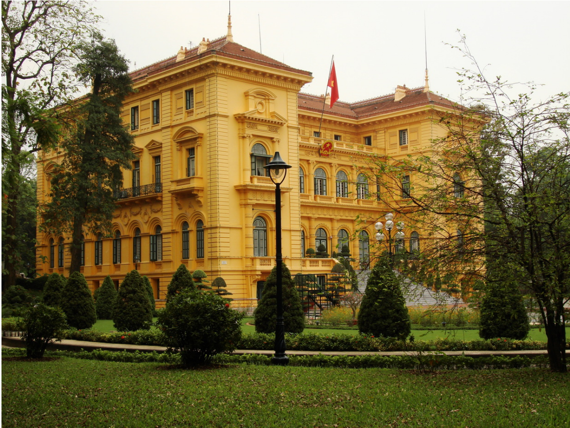
Abb. 18: Präsidentenpalast in Hanoi

Vietnam ist ein EINPARTEIENSTAAT 357 , in welchem die KOMMUNISTISCHE PARTEI VIETNAM 358 die EINHEITSPARTEI 359 darstellt und somit das Monopol auf die Macht innehat.