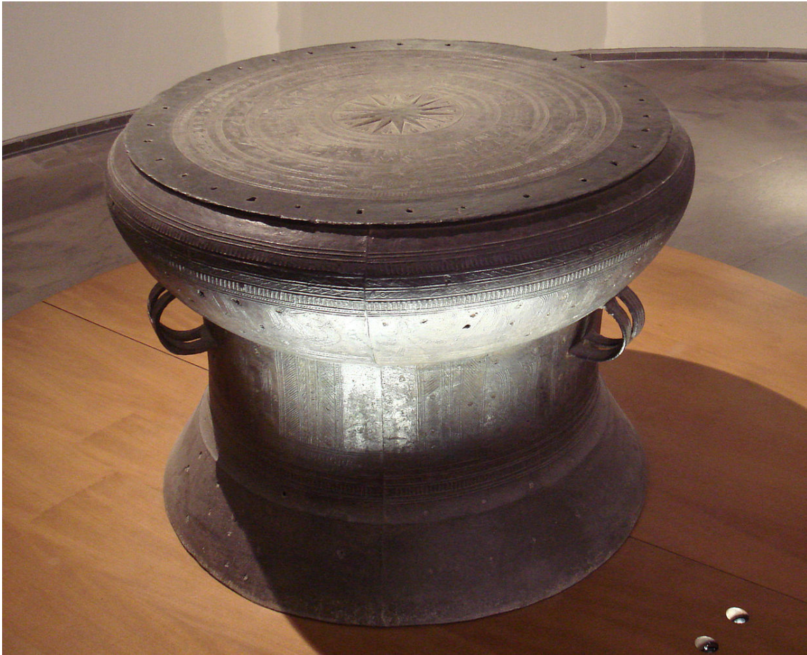
Abb. 14: Eine DONG-SON 231 -Trommel

Die frühesten Spuren menschlicher Aktivität auf dem Gebiet des heutigen Vietnam lassen sich bis vor 300.000 bis 500.000 Jahren zurückdatieren. Die älteste bisher bekannte Kultur dieser Region war die mehr als 30.000 Jahre alte DIEU-KULTUR 232 südlich von Hanoi, von wo aus sich auch die 16.000 Jahre alte HOA-BINH-KULTUR 233 weit ausbreitete. Die letzte ALTSTEINZEIT 234 liche Kultur der Region war die BAC-SON-KULTUR 235 (ca. 10.000 v. Chr.), die auch bereits Keramik anfertigte. Der Bewässerungsanbau von REIS 236 war etwa ab 3000 v. Chr. bekannt.