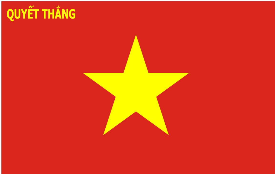
Abb. 20: Flagge der Vietnamesischen Volksarmee