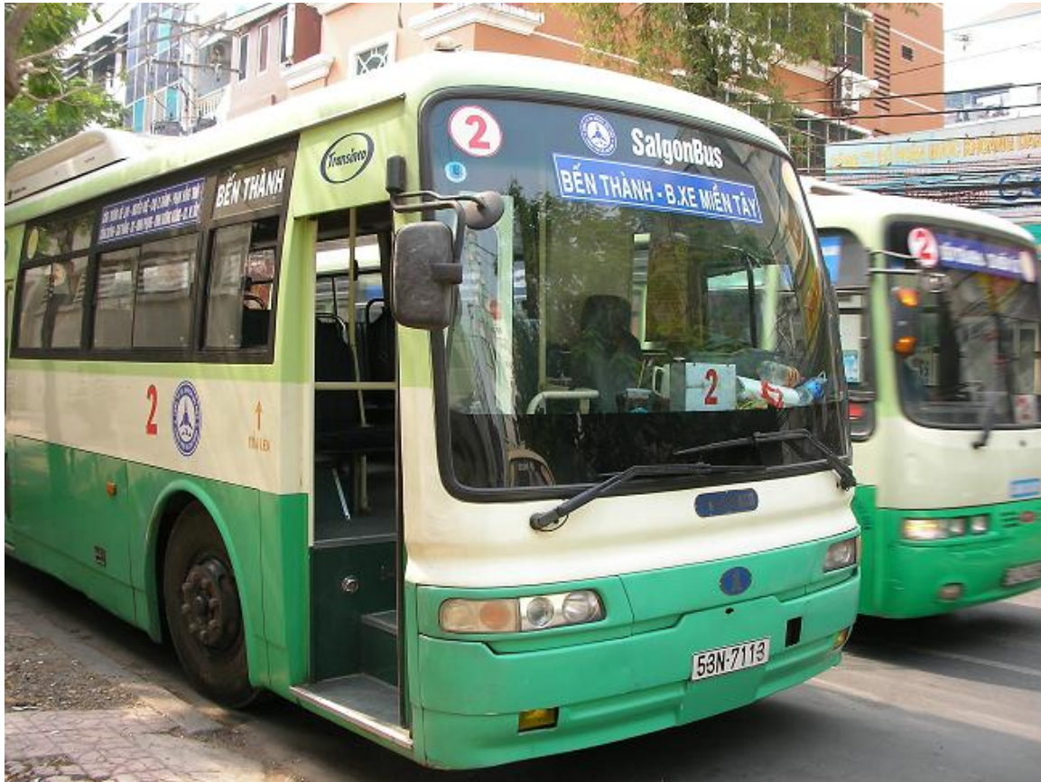
Abb. 23: Stadtbuse in HO-CHI-MINH-STADT 419

Vietnams Straßen haben eine Länge von insgesamt etwa 210.000 Kilometern, wovon jedoch nur etwa 13,5 % in einem guten Zustand und 29 % asphaltiert sind. 420 10 % der vietnamesischen Dörfer sind jährlich wegen unpassierbarer Straßen mehr als einen Monat von der Außenwelt abgeschnitten. 421