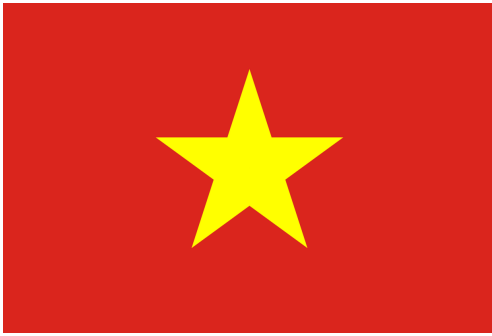
Abb. 2: Flagge Vietnams