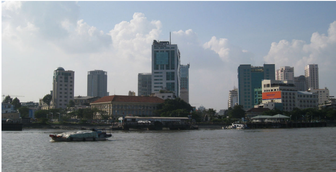
Abb. 28: Blick vom Saigon-Fluss auf Downtown

Nach der Wiedervereinigung Vietnams stand die Wirtschaft des Landes vor dem Problem, in zwei Hälften geteilt zu sein, die nach komplett verschiedenen Mustern organisiert waren: Im Norden die kommunistische, PLANWIRTSCHAFTLICH 465 organisierte Hälfte, deren Landwirtschaft in Kooperativen betrieben wurde und das Land zudem durch die Armee der USA im VIETNAMKRIEG 466 stark zerbombt worden war. Der Süden hingegen war einige Zeit marktwirtschaftlich organisiert, hatte aber während der vergangenen zwei Jahrzehnte eine Wirtschaft entwickelt, die vollständig vom Zustrom amerikanischen Geldes abhing, das bedingt durch die Militärpräsenz zufließte.