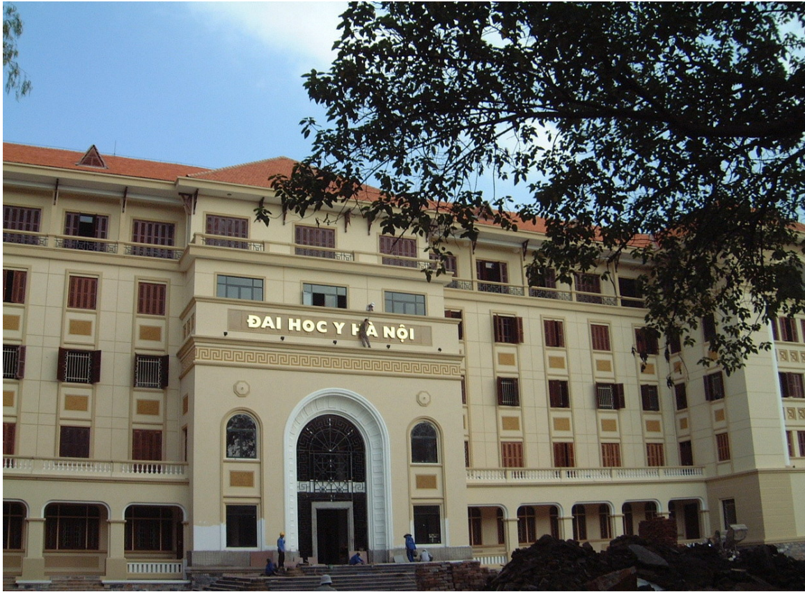
Abb. 26: Hanoi Universität für Medizin

Im Jahr 2000 wurden laut Schätzungen 92 % aller Kinder eingeschult. Jedoch nur zwei Drittel absolvierten die fünf Grundschuljahre. Speziell auf dem Land verlassen viele Kinder vorzeitig die Schule, wobei die Gründe in den Kosten für Schulgeld, Bücher und Uniformen sowie der Notwendigkeit, Geld für den Familienunterhalt verdienen zu müssen, zu suchen sind. Regional gibt es riesige Unterschiede: In einigen ländlichen Gegenden gehen nur 10 bis 15 % der Kinder länger als drei Jahre zur Schule, während in Ho-Chi-Minh-Stadt 96 % der Schüler die Grundschuljahre beenden. Nur 62,5 % der Kinder beginnen die Mittelschule. 443