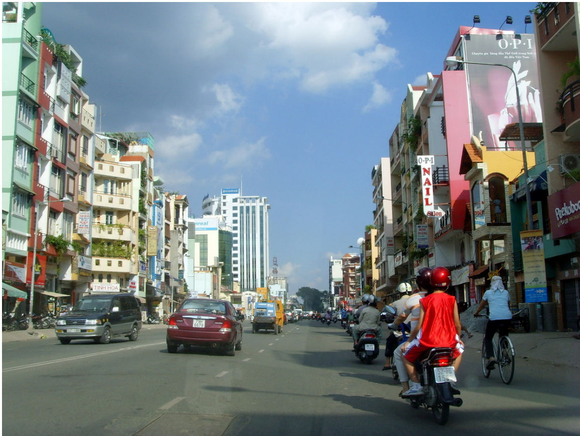
Abb. 22: Einige der auf über 2 Millionen geschätzten Mopeds in HO-CHI-MINH-STADT 418