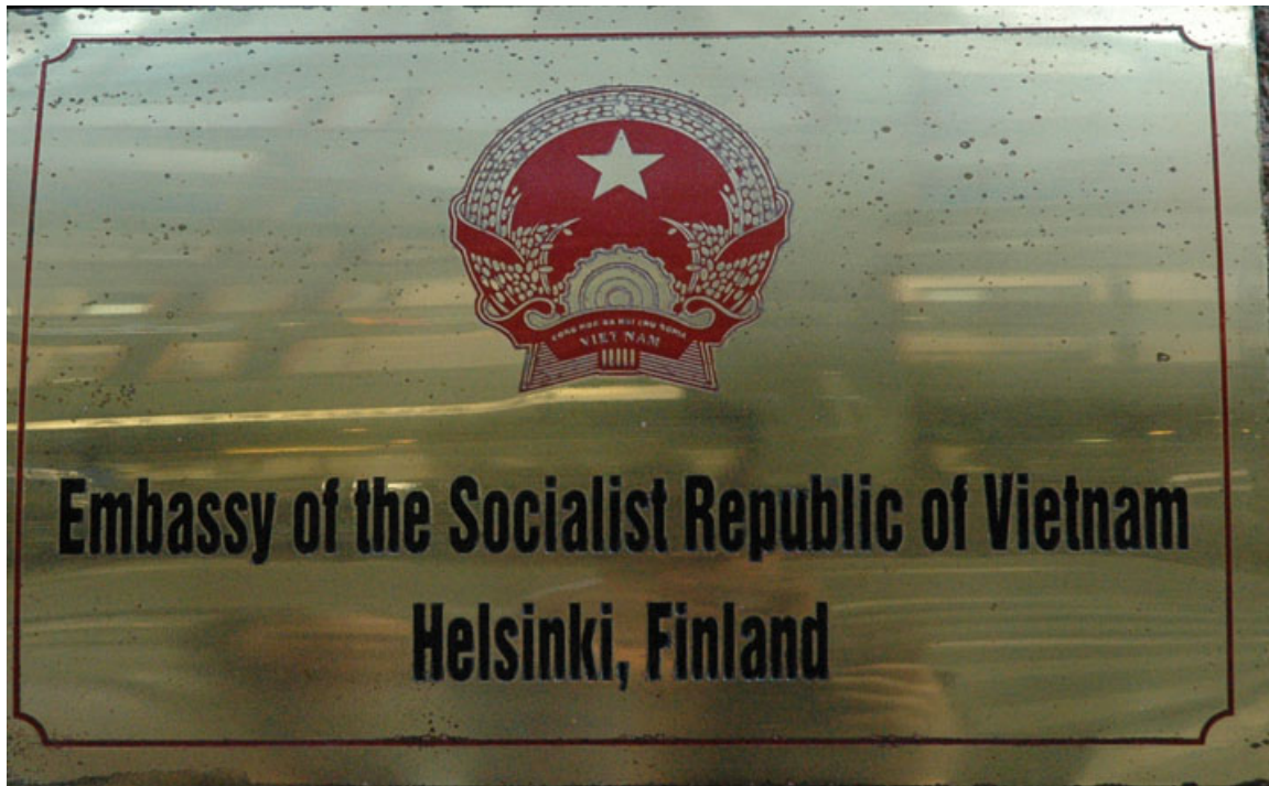
Abb. 19: Vietnamesische Botschaft in HELSINKI 381

Während des VIETNAMKRIEG 382 es und danach war Vietnam in Südostasien weitgehend isoliert. Die USA hatten ein Wirtschaftsembargo verhängt und drängten auch andere Staaten, Vietnam zu boykottieren. Speziell nach dem EINMARSCH IN KAMBODSCHA 383 (1978-89) waren auch die Beziehungen zur Volksrepublik China so gespannt, dass an der vietnamesisch-chinesischen Grenze ein Krieg ausbrach. Vietnam integrierte sich deshalb sehr stark in den Rat für gegenseitige Wirtschaftshilfe RGW 384 . Aus der Isolierung kam das Land erst nach dem Rückzug aus Kambodscha 1991 heraus.