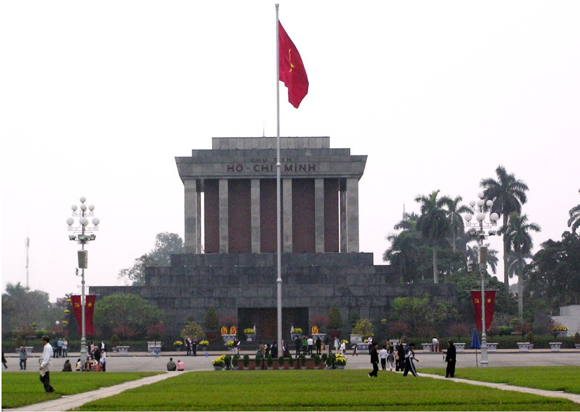
Abb. 17: HO CHI MINH MAUSOLEUM 324 in HANOI 325

Am 30. Juli 1964 fingierten die USA einen ZWISCHENFALL IM GOLF VON TONKIN 326 . Die USA starteten massive Vergeltungsangriffe auf Nordvietnam. Die erst 1971 veröffentlichten sog. PENTAGON-PAPIERE 327 zeigten allerdings auf, dass die USA diesen Krieg unter anderem seit längerem geplant hatten, um in Süd-Vietnam eine Beteiligung der Kommunisten an der Regierung zu verhindern. Ab 1965 gab es einen systematischen LUFTKRIEG 328 der USA gegen Nordvietnam; im Süden operierten US-Bodentruppen. Bis 1968 eskalierte der Krieg, obwohl die USA Nordvietnam militärisch weit überlegen waren. Auf der Seite der NATIONALEN FRONT FÜR DIE BEFREIUNG SÜDVIETNAMS 329 kämpften rund 230.000 PARTISAN 330 en und 50.000 Angehörige der offiziellen nordvietnamesischen Streitkräfte. Ihnen standen rund 550.000 Amerikaner, ungefähr die glei-