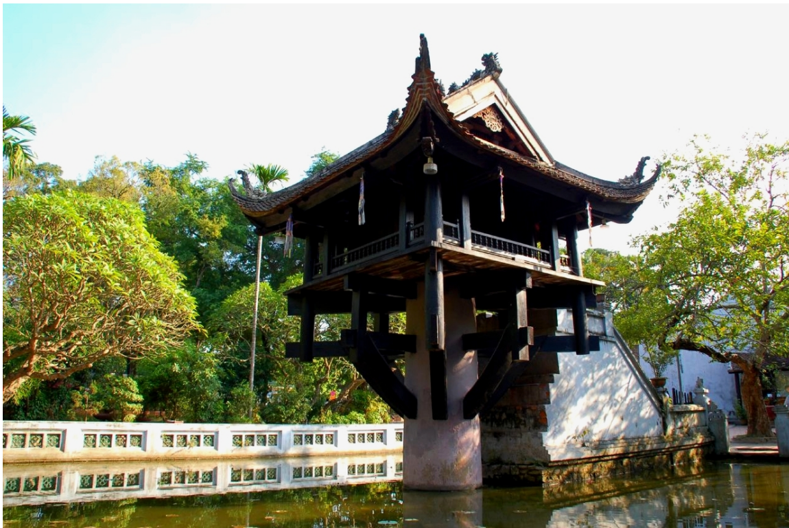
Abb. 12: Tempel mit einer Säule in HANOI 208