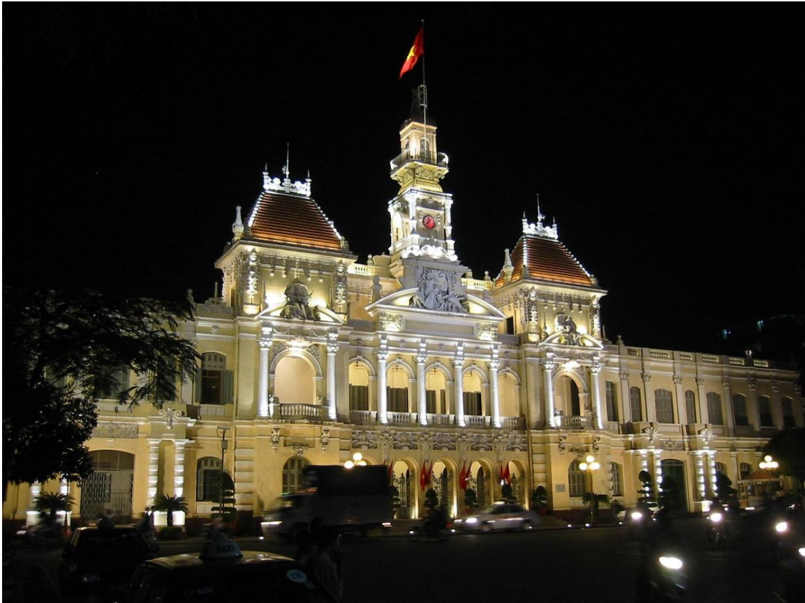
Abb. 8: Rathaus von HỒ-CHÍ-MINH-STADT 100 im Kolonialstil

Die zwei mit Abstand wichtigsten Städte sind die Hauptstadt HÀ NỘI 101 und die Hafenstadt THÀNH PHỐ HỒ CHÍ MINH (HỒ-CHÍ-MINH-STADT), FRÜHER Saigon 102 . Während letztere eine