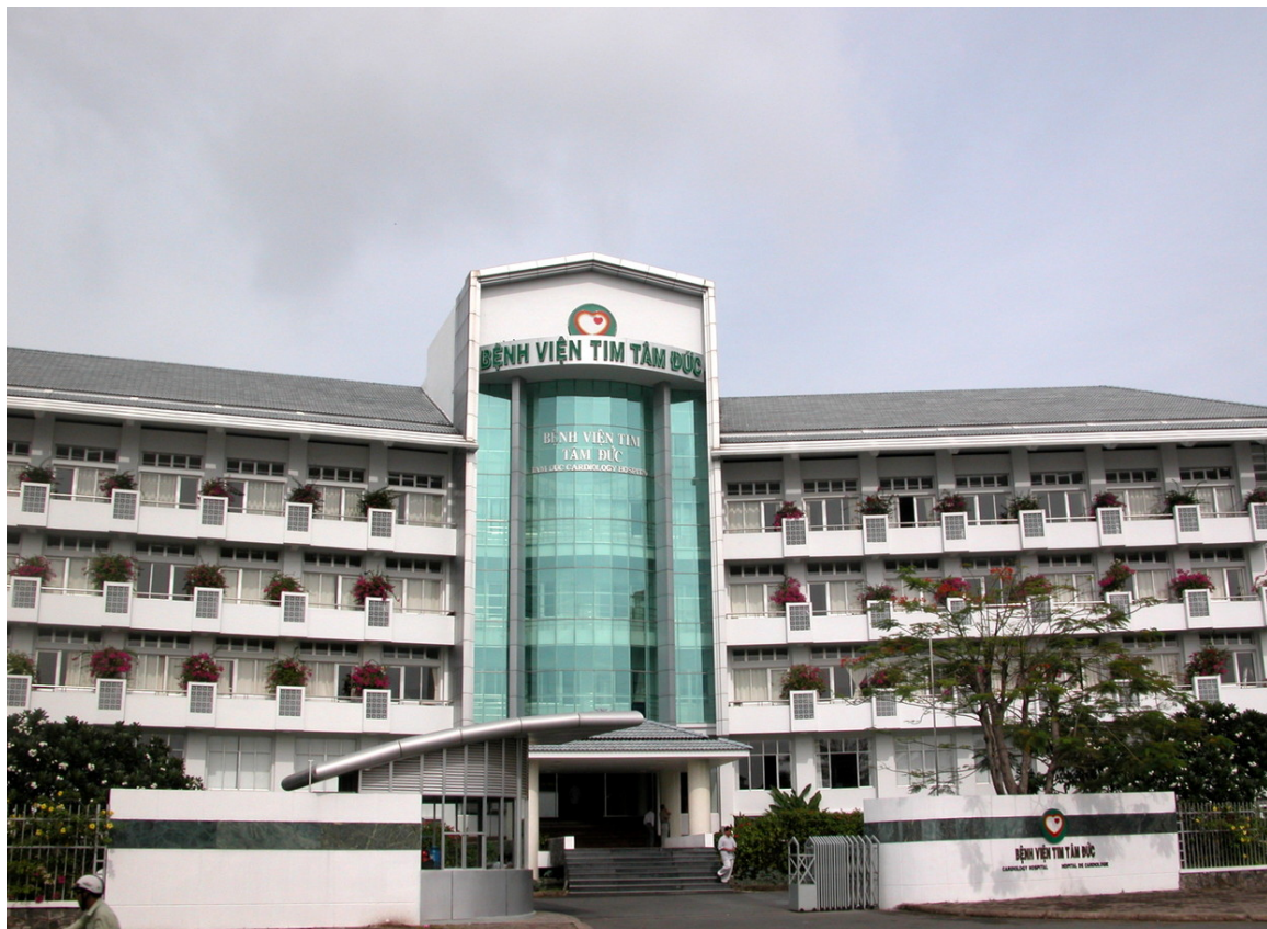
Abb. 27: Tam Duc-Krankenhaus in HO-CHI-MINH-STADT 447