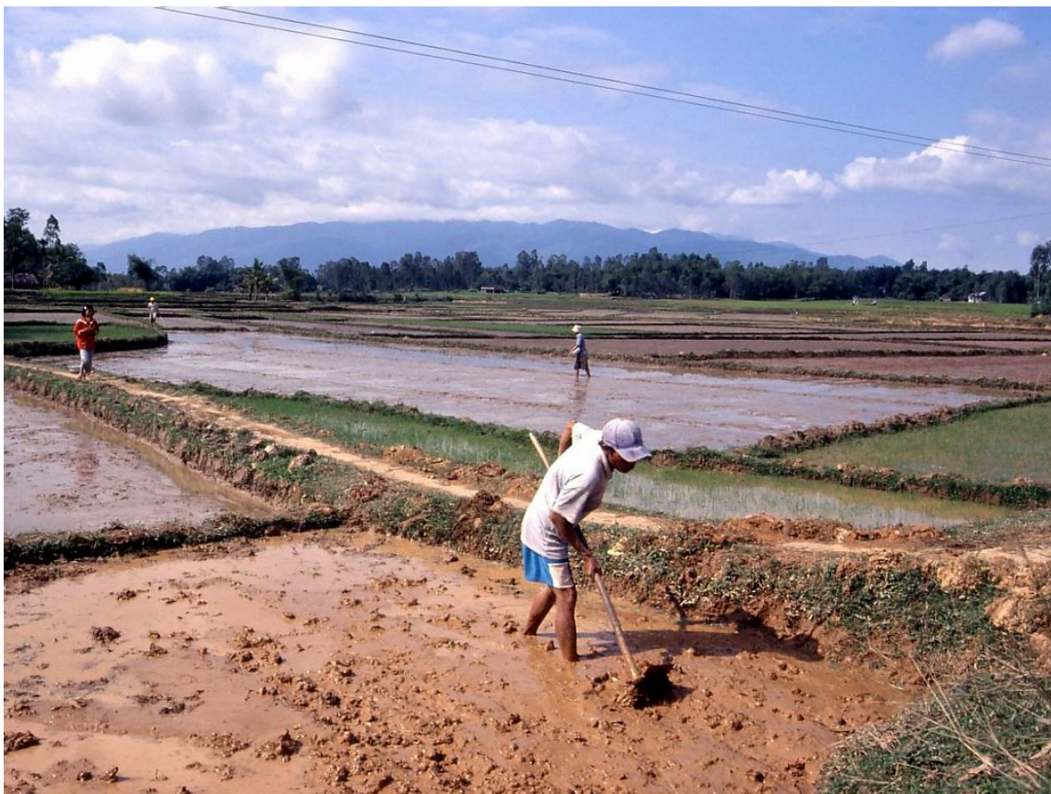
Abb. 29: Anbau von Nassreis