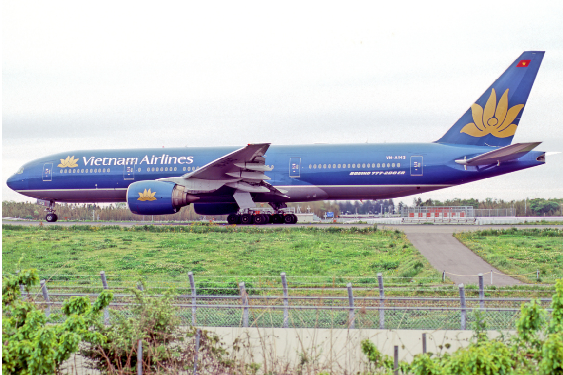
Abb. 24: Vietnam Airlines

Die nationale Fluglinie Vietnams heißt VIETNAM AIRLINES 430 . Sie bietet zahlreiche Regionalflüge in andere Großstädte Asiens sowie einige Interkontinentalflüge an und bestreitet auch den INLANDSVERKEHR 431 . Besonders im abgelegenen Bergland besitzen auch kleinere Städte einen Flugplatz. Das Fluggerät von Vietnam Airlines entspricht internationalen Standards, die Flotte der Fluggesellschaft wird ständig erweitert und umfasst daher einige sehr neue Flugzeuge.