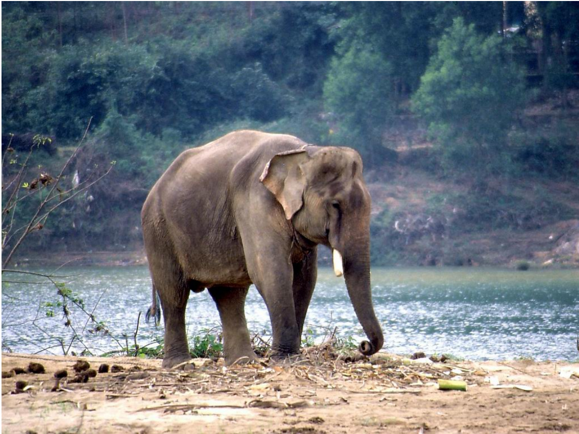
Abb. 9: Arbeitselefant am Ufer des PARFÜM-FLUSS 136 es in Mittel-Vietnam

Vietnam hat eine artenreiche Tierwelt, die jedoch durch die fortschreitende Zerstörung der Wälder und Wilderei bedroht ist. So leben nach neueren Schätzungen nur mehr rund 200 TIGER 137 und weniger als 60 ASIATISCHE ELEFANTEN 138 dort, deren Überleben fraglich ist. Die JAVA-NASHÖRNER 139 , die in Vietnam lange nur noch auf das Gebiet des CAT-TIEN-NATIONALPARK 140 s beschränkt waren, sind bereits 2010 durch Wilderei ausgerottet worden. 141,142 Außerhalb Vietnams leben die seltenen Tiere nur noch im UJUNG KULON 143 -Nationalpark auf der Insel JA-