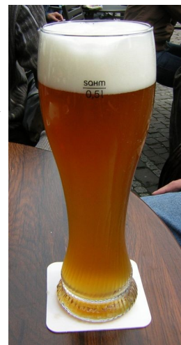
Abbildung 1: Alkoholisches Getränk

Meiden Sie strengstens den Gebrauch von Alkohol und Drogen im Betrieb. Das gilt auch für leichte Alkoholika, z.B. Bier oder Wein. Es ist für Ihre Kollegen unzumutbar, mit jemandem zusammenzuarbeiten, der seine Sinne nicht zusammen hat und erhöht das Unfallrisiko ganz erheblich. In den meisten deutschen Unternehmen gibt es Betriebsvereinbarungen, die den Gebrauch von Alkohol und Drogen strengstens untersagen - auch gegen Sanktionen, die bis zur fristlosen Kündigung reichen können.