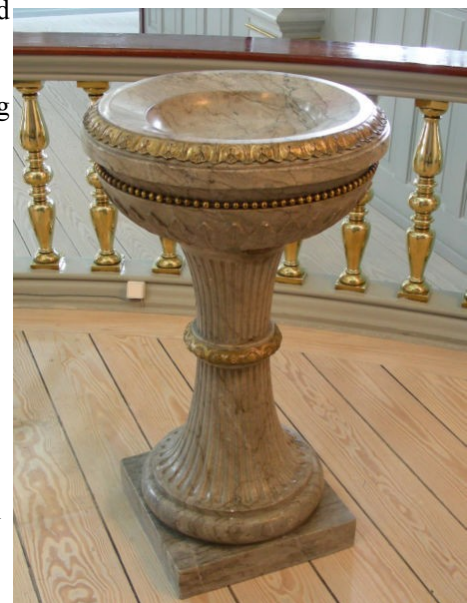
Abbildung 7: Taufbecken

Je nach Art der Taufe werden auch z.B. die Eltern oder die Taufpaten in den zur Taufe gehörigen Taufritus eingebunden. Hierüber muss man sich ggf. vorab informieren.