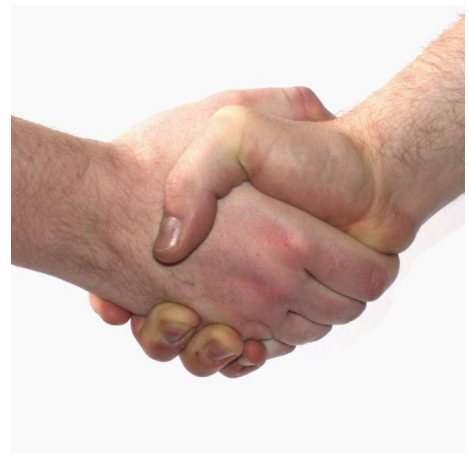
Abbildung 4: Händedruck