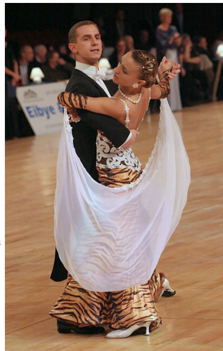
Abbildung 5: Tanzhaltung Tango

Wenn Sie ein guter Tänzer sind, werden Sie es gewohnt sein, den rechten Ellenbogen nicht hängen zu lassen. Bedenken Sie dabei, dass ein normales Jackett (kein Turnieranzug) nicht sehr attraktiv aussieht, wenn Sie die Arme hochheben. Sie sollten deshalb darauf verzichten, den rechten Ellenbogen zu hoch zu nehmen. Das führt nebenbei auch dazu, dass Sie weniger Platz auf der Tanzfläche benötigen, der auf Tanzbällen in der Regel nicht vorhanden ist.