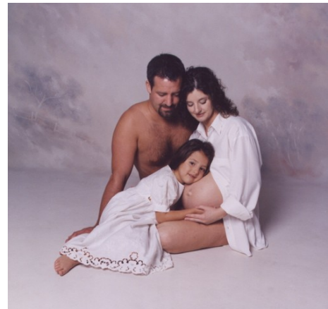
Abbildung 6: Junge Familie erwartet Nachwuchs

Ob die biologische Reproduktions-Funktion der Spezies „Mensch“ der Institution „Familie“ bedarf, ist teilweise umstritten. Zur biologischen Basis einer Familie gehören die Gebärfähigkeit und die Zeugungsfähigkeit. Dies ist jedoch nicht der Fall wenn z.B. ein Ehepaar keine Kinder bekommen kann und ein Kind adoptiert. Trotzdem kann dann von einer Familie gesprochen werden. Kennzeichnend ist jedoch das Zusammenleben von mindestens zwei Generationen. Die Reproduktionsfunktion dient der Sicherung der Generationsfolge durch Weitergabe des Lebens. Die Familie prägt die Qualität der Reproduktion einer Gesellschaft.