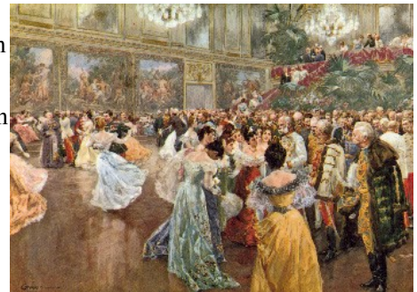
Abbildung 3: Klassischer Ball