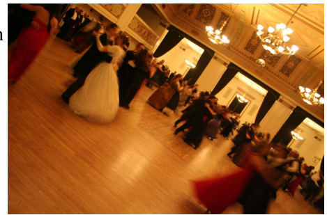
Abbildung 2: Ball heute

Wenn Sie den Ball verlassen und Sie die Personen an ihrem Tisch nicht gekannt haben und sich mit ihnen auch nicht viel unterhalten haben, dann wird nicht von Ihnen erwartet, dass Sie sich förmlich verabschieden. Ein kurzes, aber freundliches „Auf Wiedersehen“ reicht völlig aus. Haben Sie sich aber gut mit Ihren Tischnachbarn unterhalten, dann sollten Sie sich mit einem Händedruck verabschieden. Wenn man sich von Ihnen mit einem Händedruck verabschiedet, dann stehen Sie kurz auf. Als Dame müssen Sie, wie oben geschildert, nicht aufstehen.