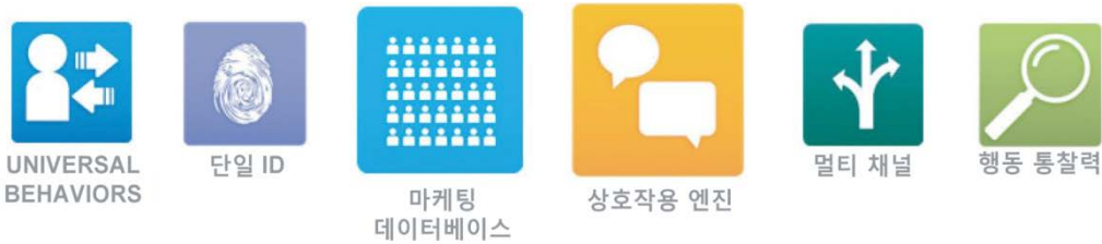
그림 1. Silverpop 마케팅 플랫폼